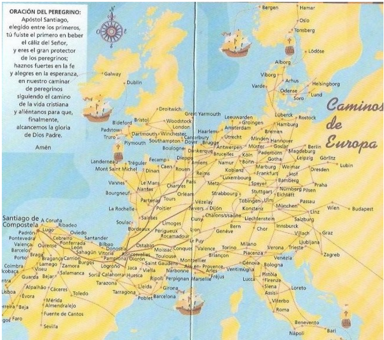
Figura 2. Cartina delle Strade per San Giacomo di Compostela nell'Europa Occidentale : È simile a quella di Figura 1. , ma cita più nomi di città e traccia più percorsi. Essa compare stampata nella 'credencial' del 2002, distribuita ufficialmente dal Capitolo della Cattedrale di Santiago.

continua la didascalia di Figura 1) che va da Tolosa al colle del Somport dove ha inizio la “via o cammino Aragonese”. 2. La seconda strada è la via podiensis , indicata come via dei “Borgognoni o dei Teutoni”. Citando solo Conques e Moissac, come tappe fra Le Puy e Ostabat, la Guida lascia senz'altro sopravvivere delle incertezze sul suo preciso tracciato. ... 3. La terza strada è la via turonensis . La grande devozione è quella per San Martino di Tours, apostolo dei Galli, anteriore a quella di San Giacomo. Dopo Tours, i pellegrini si portavano a Poitiers, Saint-Jean d'Angely, ..., passavano per le Lande e raggiungevano Ostabat, punto di partenza del Cammino Navarrino e inizio del Camino Francés che porta a Compostela. 4. Il quarto cammino è quello che attraversa Sainte-Marie-Madeleine di Vézelay, Saint Leonard nel Limosino, ... . Ma da Ostabat, passando per Logroño, Burgos, Leon, Astorga, ..., si raggiunge Santiago de Compostela [da “Prefazione: Quattuor viae sunt ”. In: Alla conquista di Compostela (Titolo originale: Priez pour nous à Compostelle) . Di Pierre Barret e Jean-Noël Gurgand . Prefazione di Arlette Moreau, Presidente di Compostelle 2000, Direttrice della Rivista 'Chemins de Compostelle'. © Hachette 1999, Edizioni PIEMME, Casale Monferrato, 2000].