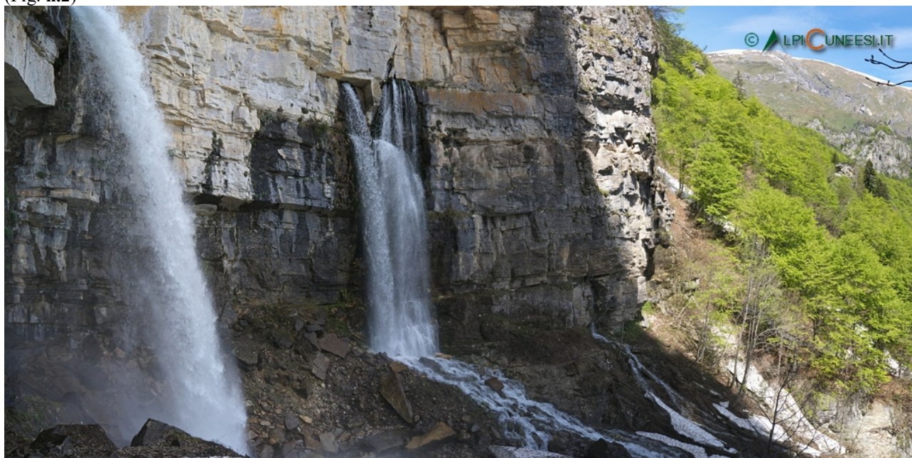
Figura 2. Il Pis: [“Sulla parete rocciosa, si vedono tre grandi buchi: quello centrale è il più grande, si trova all'altezza di circa 20 trabucchi (n.d.r.: a circa 60 m di altezza) e quando comincia a scaricare acqua lo fa con un grande rumore, uguale al rombo del tuono; in seguito, quando l'acqua fuoriesce precipitando fragorosamente, si forma un arco parabolico, che arriva al suolo, e scava con la forza della caduta un grande bacino di forma ovale, che riceve anche le acque dagli altri fori, e anche da un ruscello sommerso. Queste acque mescolandosi formano il torrente Pesio, che scorre tra le rocce in due tratti distinti fino alla Certosa, e di qui in poi dopo la Chiusa, diventa affluente del Tanaro dalle parti di Carrù”]