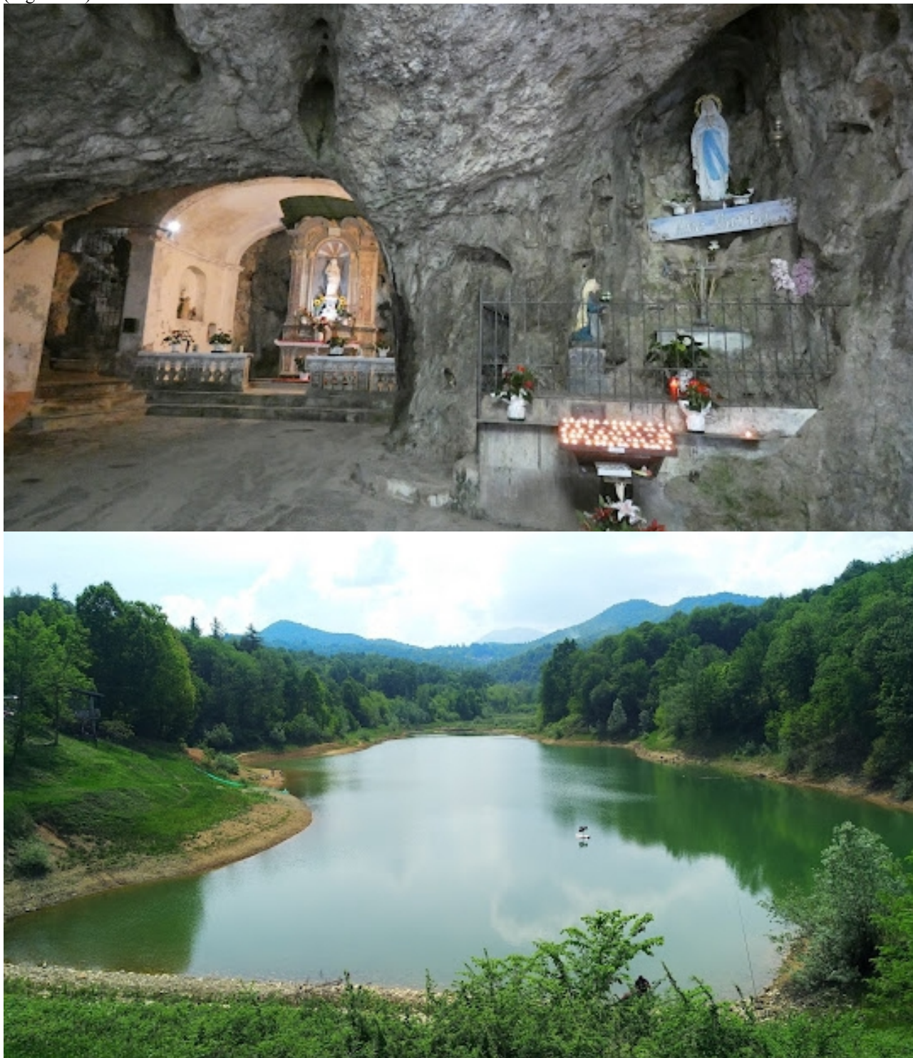
Figure 5-6. Pianfei. Santuario di Santa Lucia: lo vedi in alto a sinistra dalla statale che va da Roccaforte a Villanova Mondovì. Lago di Pianfei.