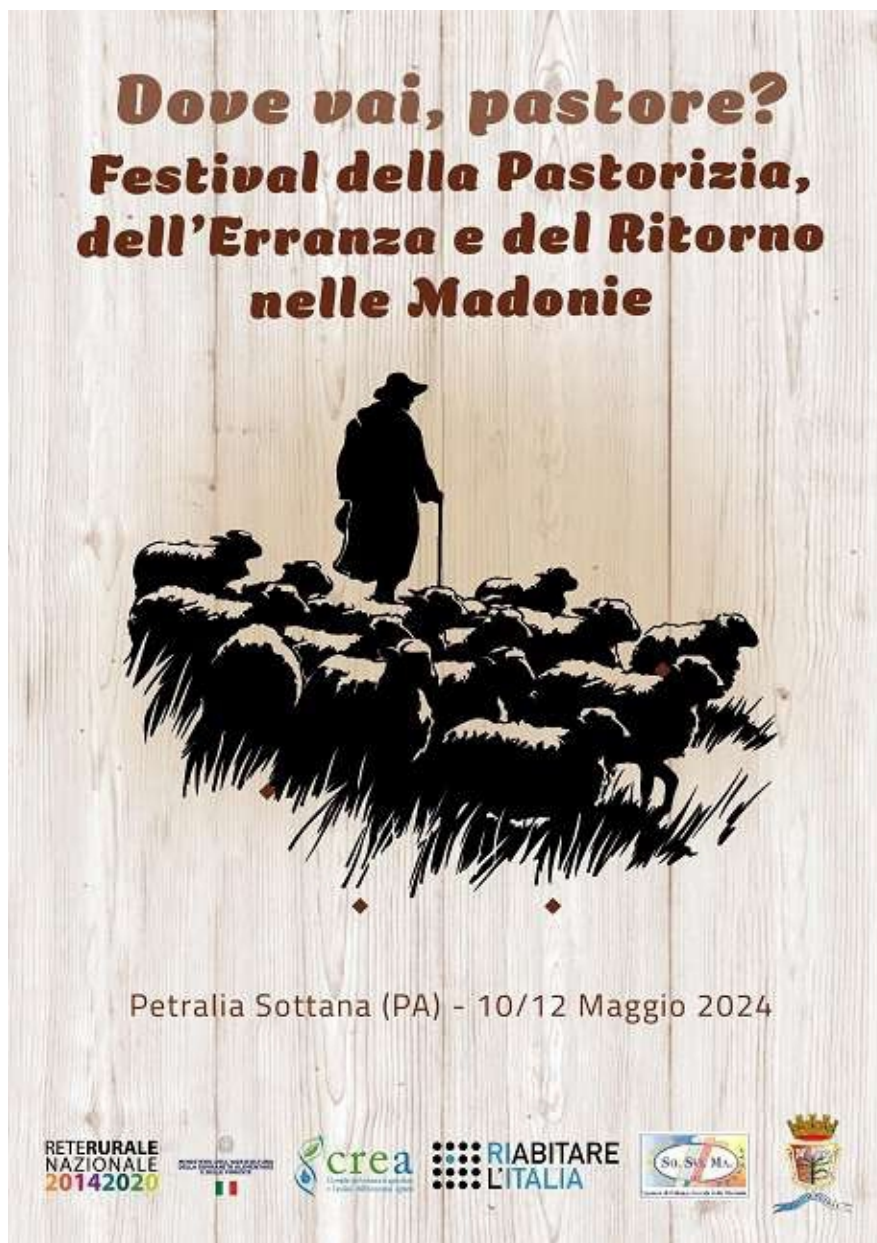
Figura 7. La locandina del Festival della Pastorizia, a Petralia Soprana (PA), Sicilia, dal 10-12 maggio 2024.