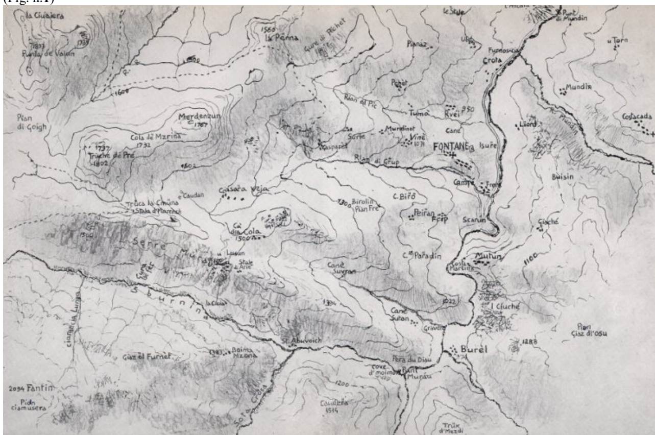
Figura 1. Cartina di Fontane, frazione di Frabosa Soprana. https://ekye.it/fontane/