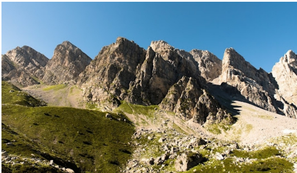
Figura 4. Parco naturale Marguareis.